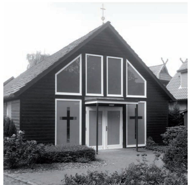
Blick auf die Borsteler Kapelle.