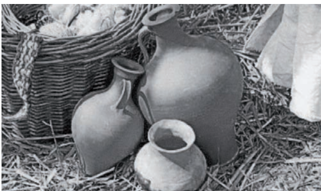
Impressionen des Angedenkens: Die Hagia Sophia (oben) und ein bildlicher Krug für die Erinnerungen.