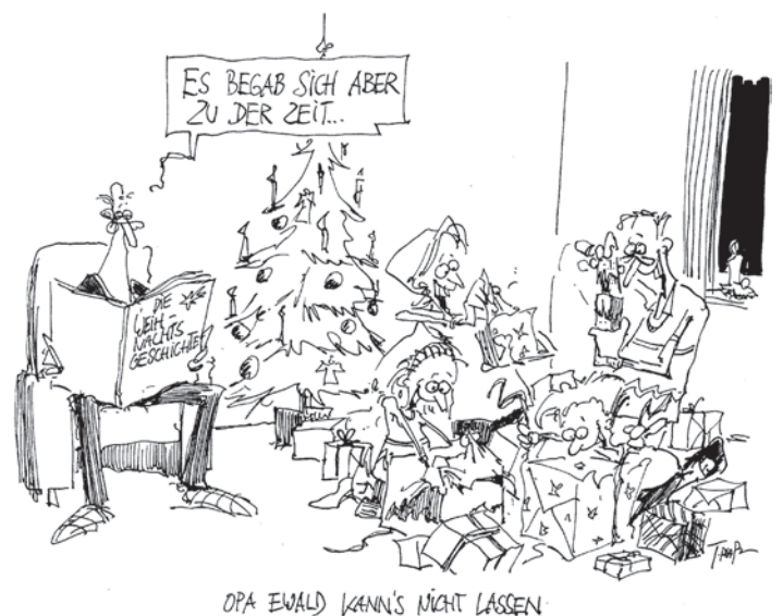
Zeichnung: Thomas Plaßmann

Wir wünschen viel Spaß bei den Weihnachtsvorbereitungen!