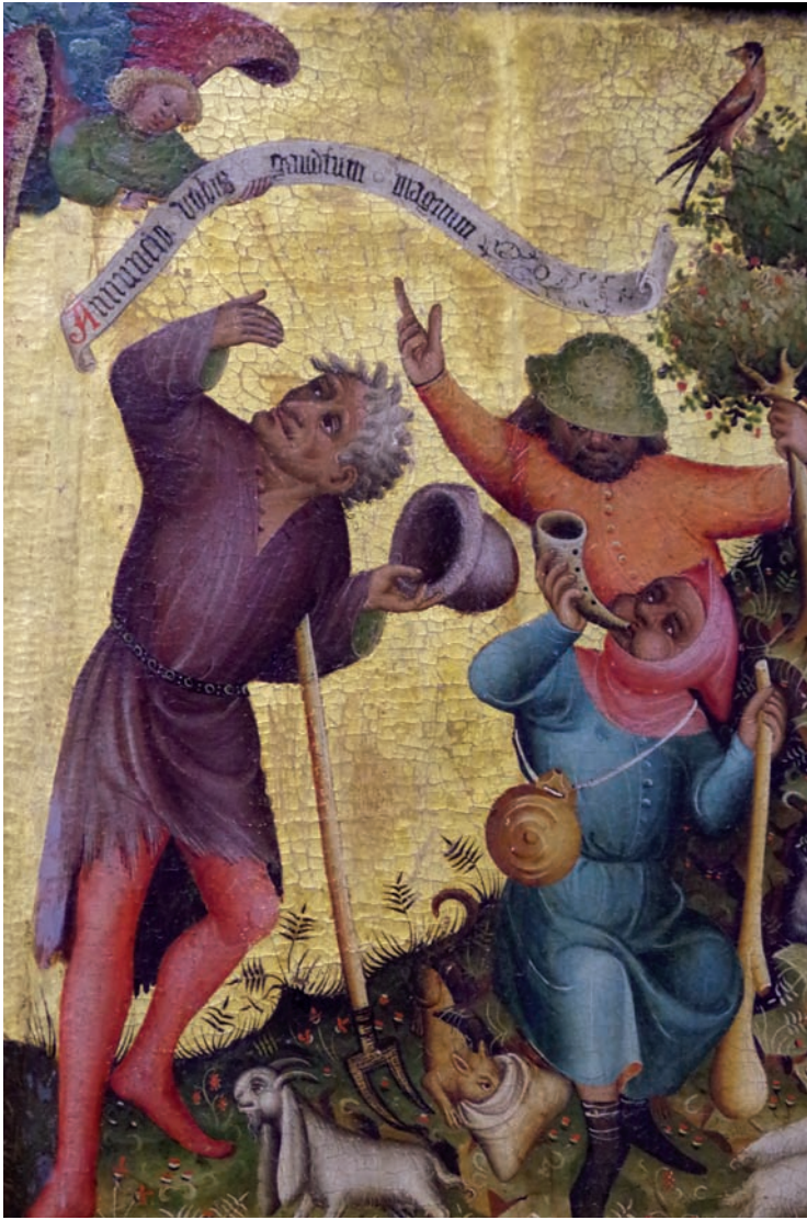
Die Verkündigungsszene des Engels an die Hirten, dargestellt im so genannten „Buxtehuder Altar“ von Meister Bertram von Minden.