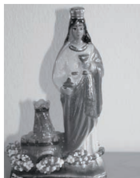
Figur der heiligen Barbara.

Oder die Figur der Muttergottes „Virgen de la Caridad del Cobre“ – sie steht in der katholischen Verehrung für die Liebe und die Fürsorge der Mutter. In der Santería heißt sie „Ochún“ und ist die Göttin des Wassers, der mütterlichen Jungfräulichkeit und der Liebe. Und die Menschen in den verschiedenen Kulturen versuchen auf ihre kulturspezifische Art mit diesen Aspekten umzugehen, stellt Bernd Schmelz fest. Und dies zeigt, dass wir Menschen uns in unseren Bedürfnissen nach Schutz und Hilfe sehr ähnlich sind. Wie gut, wenn wir so tolerant sind, unterschiedliche Ausprägungen unseres Glaubens nebeneinander bestehen zu lassen.