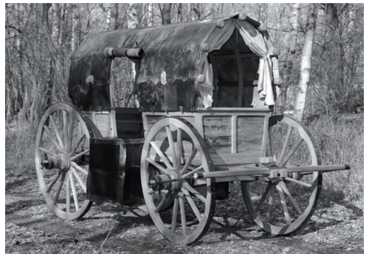
Wichtiges Gefährt zur Verbreitung der Reformation: Luthers Reisewagen (Nachbau).