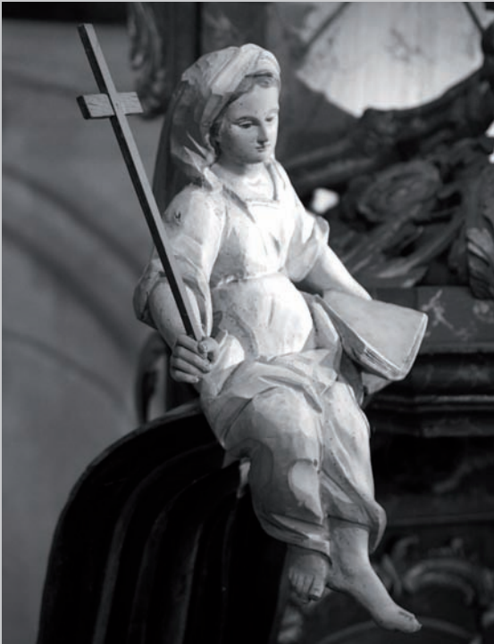
Kunst in der Borsteler Kirche St. Nikolai: Am Altar symbolisiert der Engel den Glauben.

Ich war überrascht, was ich alles noch in unserer Kirche St. Nikolai entdecken konnte, obwohl ich doch schon seit Jahren die Kirche zu kennen meinte.