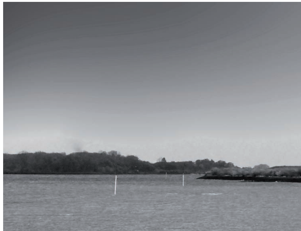
Neben den vielen Kirchen sind auch die Elbe und ihr Deich oft Ziel für Touristen, aber auch für die Menschen, die in unserer Region leben. Foto: Karen Jäger