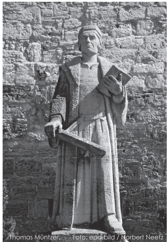
Thomas Müntzer.

Thomas Müntzer (1489- 1525) war ein weiterer Theologe, Reformator und Revolutionär – in der Zeit des Bauernkrieges. Müntzer war als Priester zunächst