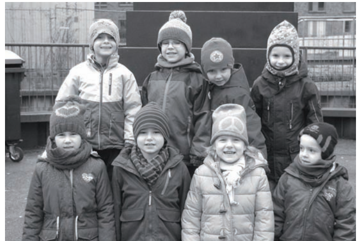
„Wir können das auch“ – die zukünftigen Schulkinder der Kita „Am Fleet“ nach ihrem Theaterbesuch in Hamburg.