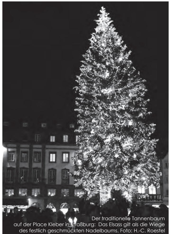
Der traditionelle Tannenbaum auf der Place Kleber in Straßburg: Das Elsass gilt als die Wiege des festlich geschmückten Nadelbaums.