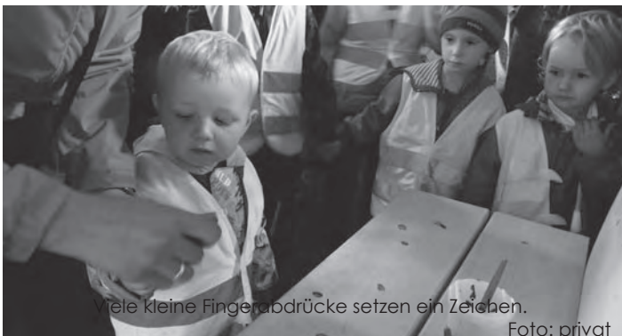
Viele kleine Fingerabdrücke setzen ein Zeichen.