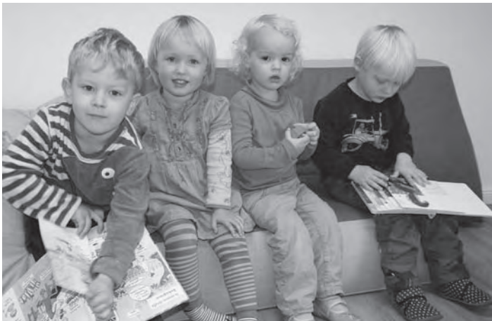
Einige Kinder der „Bienen“-Schar.