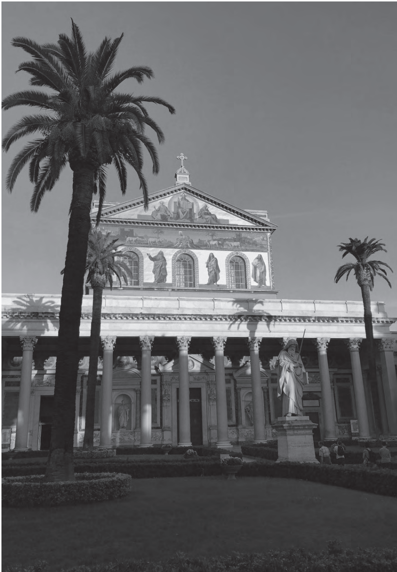
Nur zwei der unzähligen Impressionen dieser Romfahrt: die Basilika San Paolo Fuori le Mura (oben) und die Casa delle Vestali (unten).

Eine Studienfahrt der Kirchengemeinde im Oktober 2017