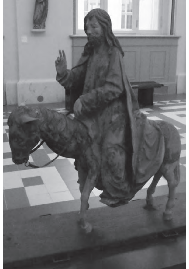
Christus als Eselsreiter – Holz, Franken um 1520/30, mitgeführt bei Palmsonntagsprozessionen. Skulpturensammlung Bode-Museum Berlin