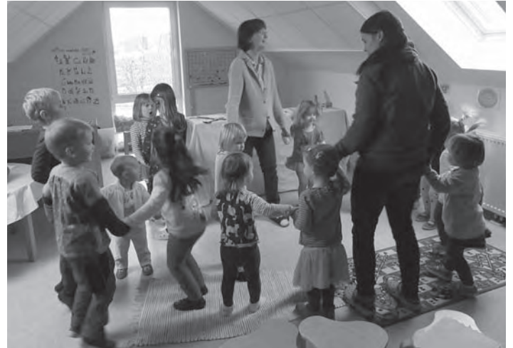
Viel Spaß hatten die Kita-Kinder mit ihren Erzieherinnen beim „Kartoffeltanz“.