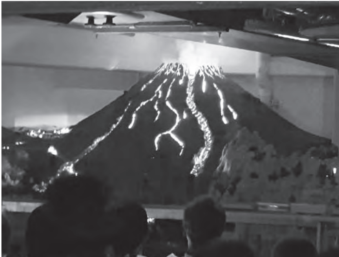
Imposant sah er aus, der Vulkanausbruch im Hamburger Miniatur-Wunderland!