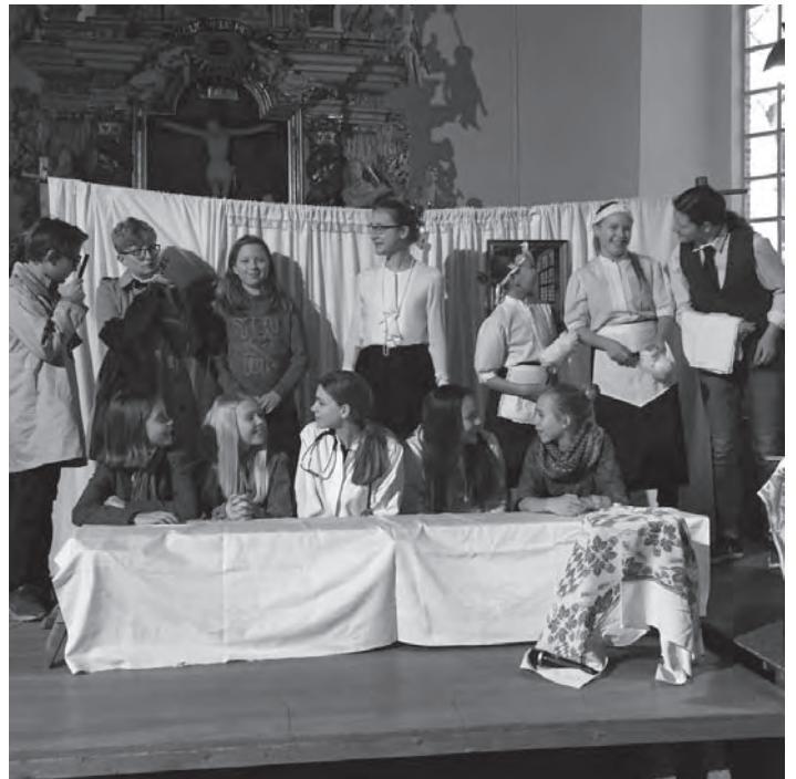
Aufgeführt von der Theatergruppe am Freitag, 19. Januar, um 18 Uhr in der St.-Matthias-Kirche.