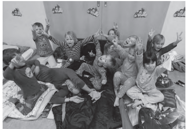
Busfahren ist doch super einfach! (links) – Das Schlafest: noch mal kräftig feiern, bevor es in die erste Klasse geht! (oben).