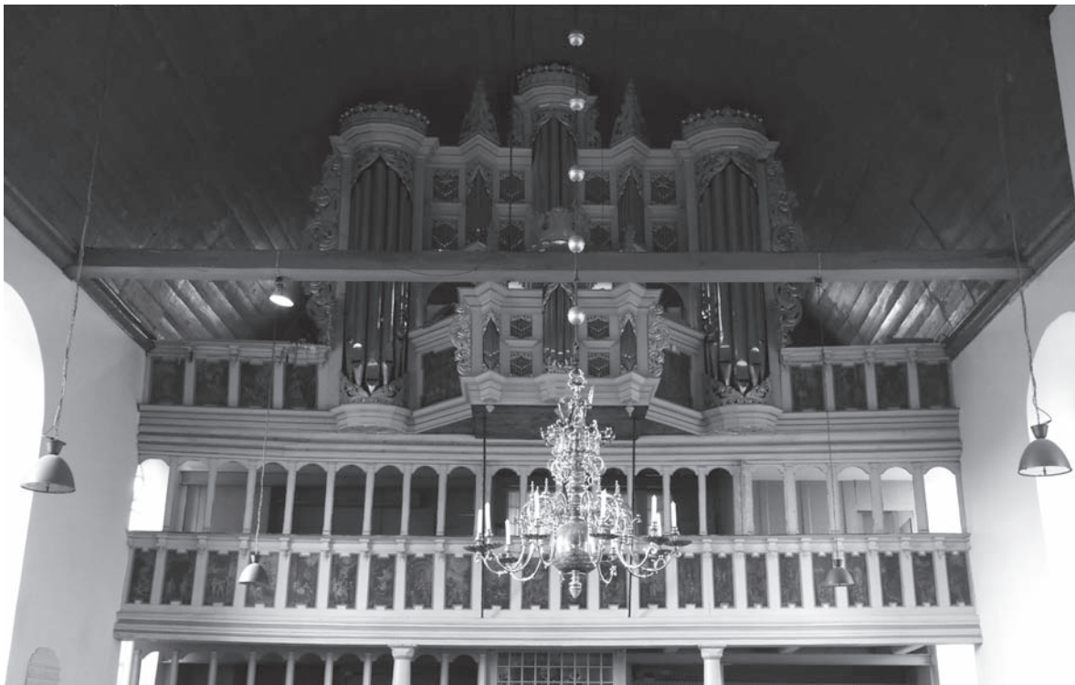
Blick auf die Jorker Schnitger-Führer-Orgel in der St.-Matthias-Kirche.

Sonntag, 1. Juli Gottesdienst und Matinée