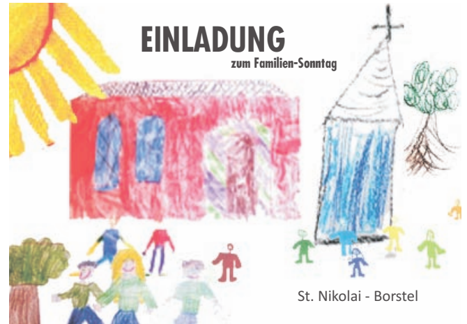
St. Nikolai - Borstel