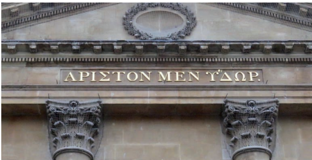
Das Beste aber ist das Wasser!