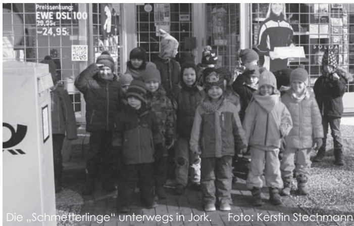
Die „Schmetterlinge“ unterwegs in Jork.