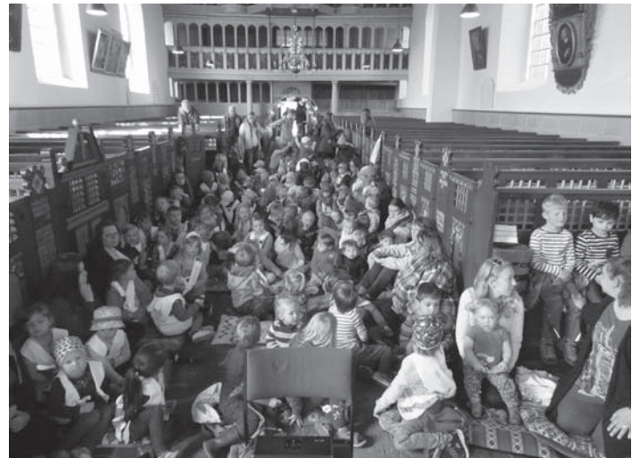
Alle vereint in der großen Matthiaskirche: die kleinen Gäste aus den Jorker Kitas Hand in Hand, Am Fleet und Jorkerfelde mit ihren Erzieherinnen beim Blütenfestgottesdienst.