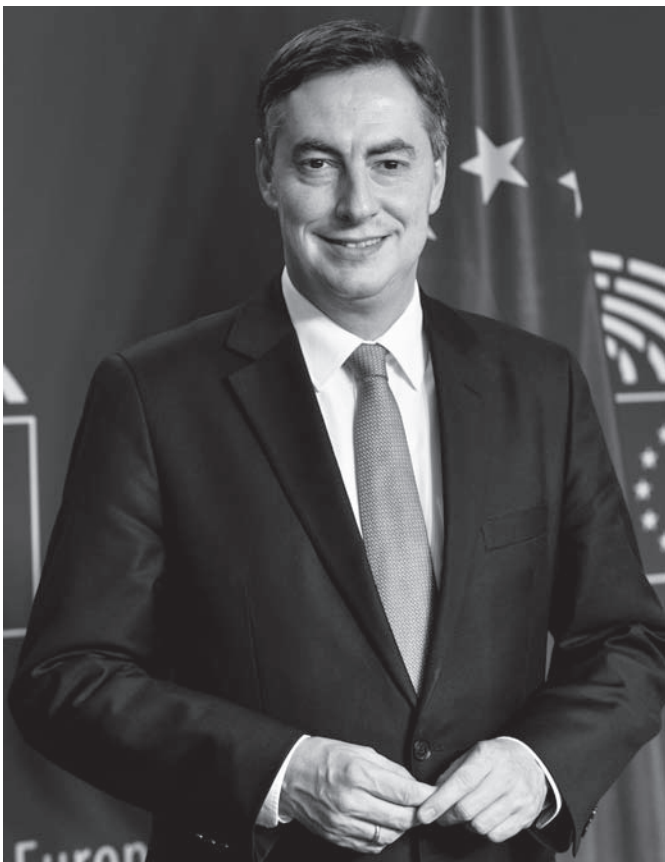
David McAllister, CDU-Spitzenpolitiker aus Niedersachsen, ist seit 2014 Abgeordneter des Parlaments der Europäischen Union in Brüssel.

Vortragsreihe in St. Matthias im November 2018