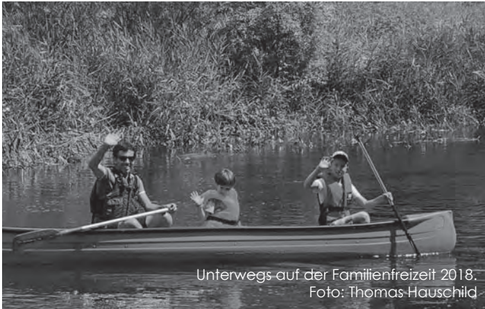
Unterwegs auf der Familienfreizeit 2018.